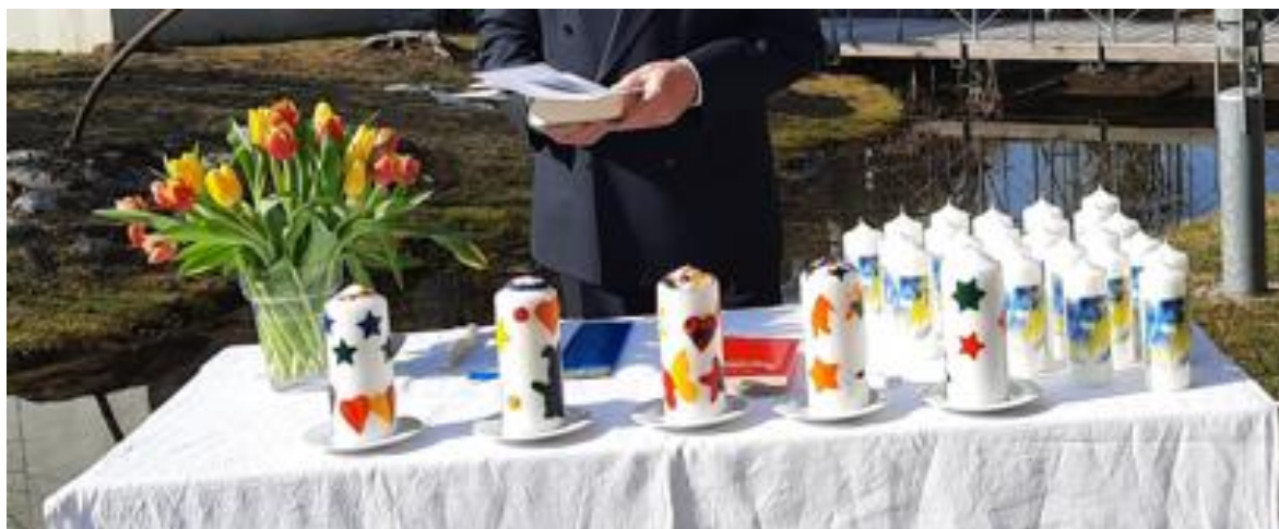
Friedensgebet am 27. März 2022