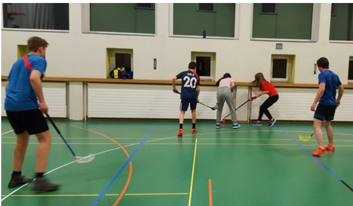
«Halla aviarta» a Rabius

Suenter las vacanzas d'atun havessan nus bugen puspei continuau cun nossa purschida che ha liug a Rabius ed a Trun, mo puspei nuot. Quei project vegn promovius e sustenius finanziamein digl uffeci da sanadad dil cantun Grischun ed el vegn apprezziaus fetg da beinenqual giuvenil.