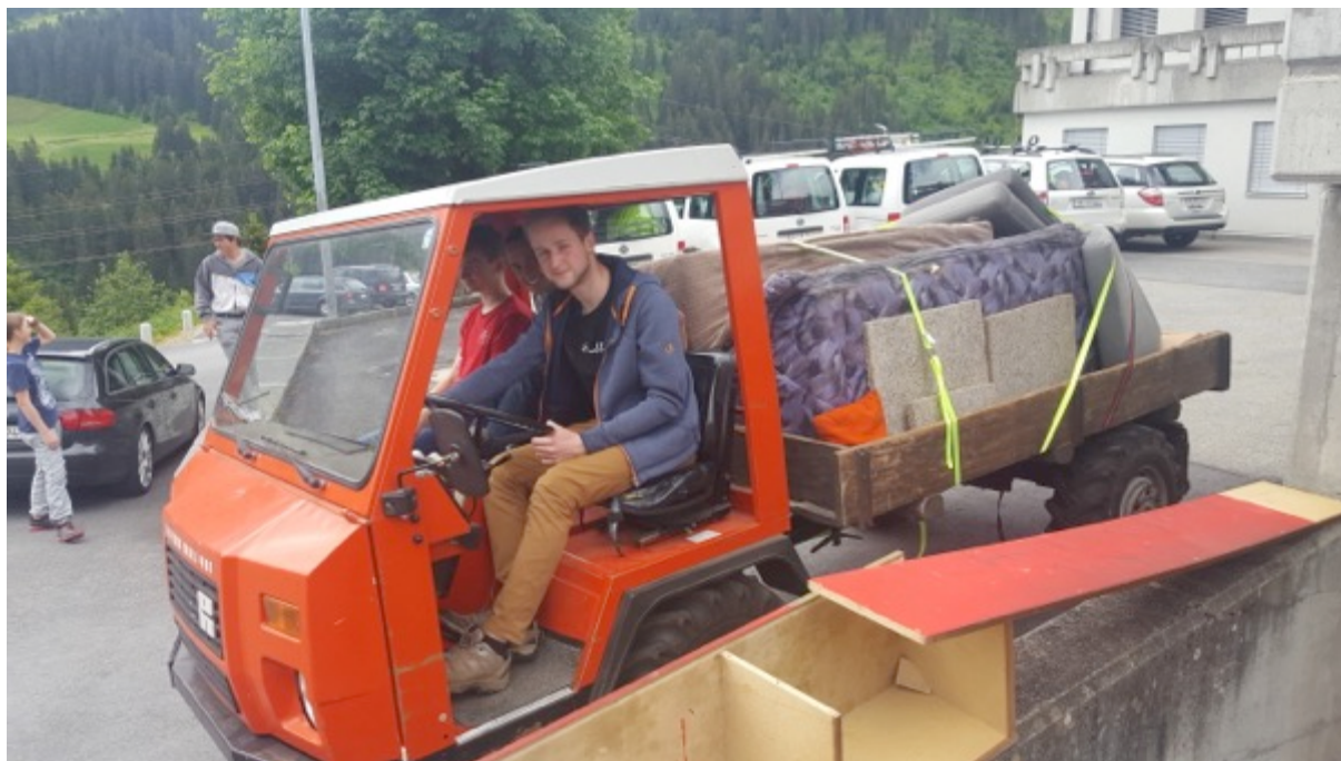
Ils menaders*as dalla Talina dismettan ils canapès vegls

Quei ei mintgamai in detg eveniment. Cheu ves'ins che giuvens carschi e giuvenils ein prompts da far lavur cumina.