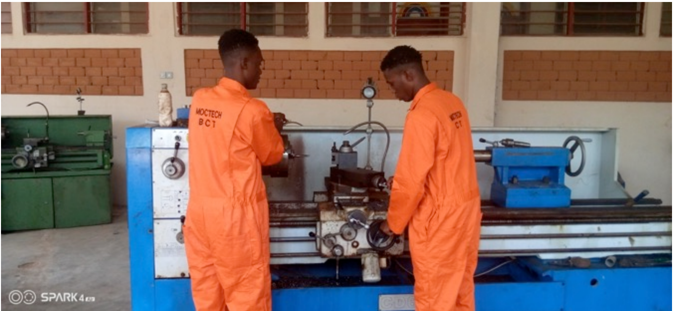
Der Maschinenpark der MOCTECH ist weitherum im Bundesstaat einmalig

richt wieder starten konnte, war die Freude riesig und die grossen Schulfeste zur Immatrikulation und zum Ausbildungsabschluss wurden nachgeholt. Für das Schuljahr 2021 wurden 140 neue Student*innen aufgenommen, so dass die Platzkapazität voll ausgelastet ist.