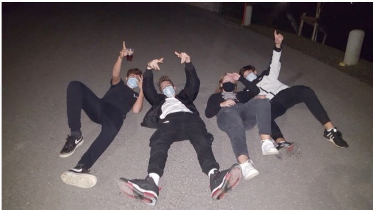
Giuvenils cun mascrina avon la Talina