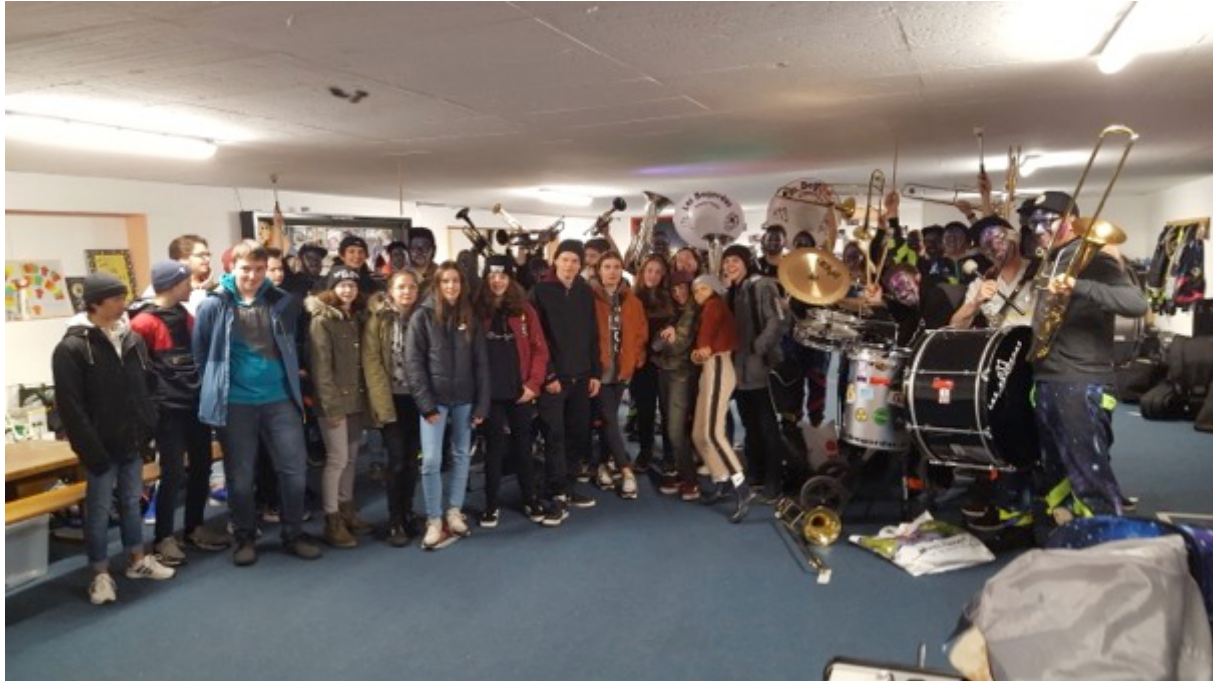
Fuffernadi tier las Bagordas a Mustér

30 da settember: «Cult dil tgierp e nutriment», sera publica per promover la sanadad psichica a Trun