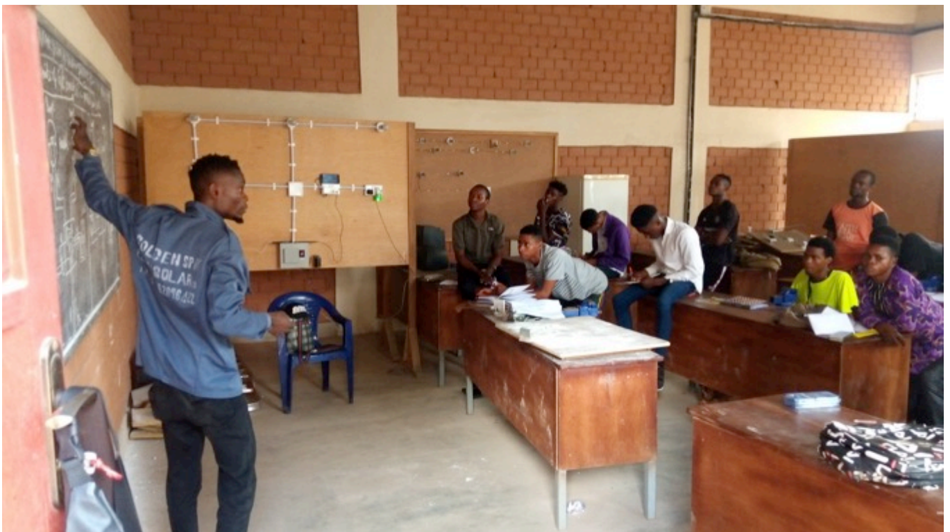
Theorieunterricht in Elektrotechnik

richt wieder starten konnte, war die Freude riesig und die grossen Schulfeste zur Immatrikulation und zum Ausbildungsabschluss wurden nachgeholt. Für das Schuljahr 2021 wurden 140 neue Student*innen aufgenommen, so dass die Platzkapazität voll ausgelastet ist.