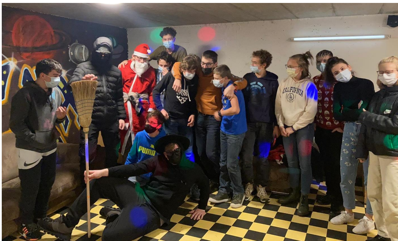
Viseta da Sontgaclau el local Pistregn a Surrein