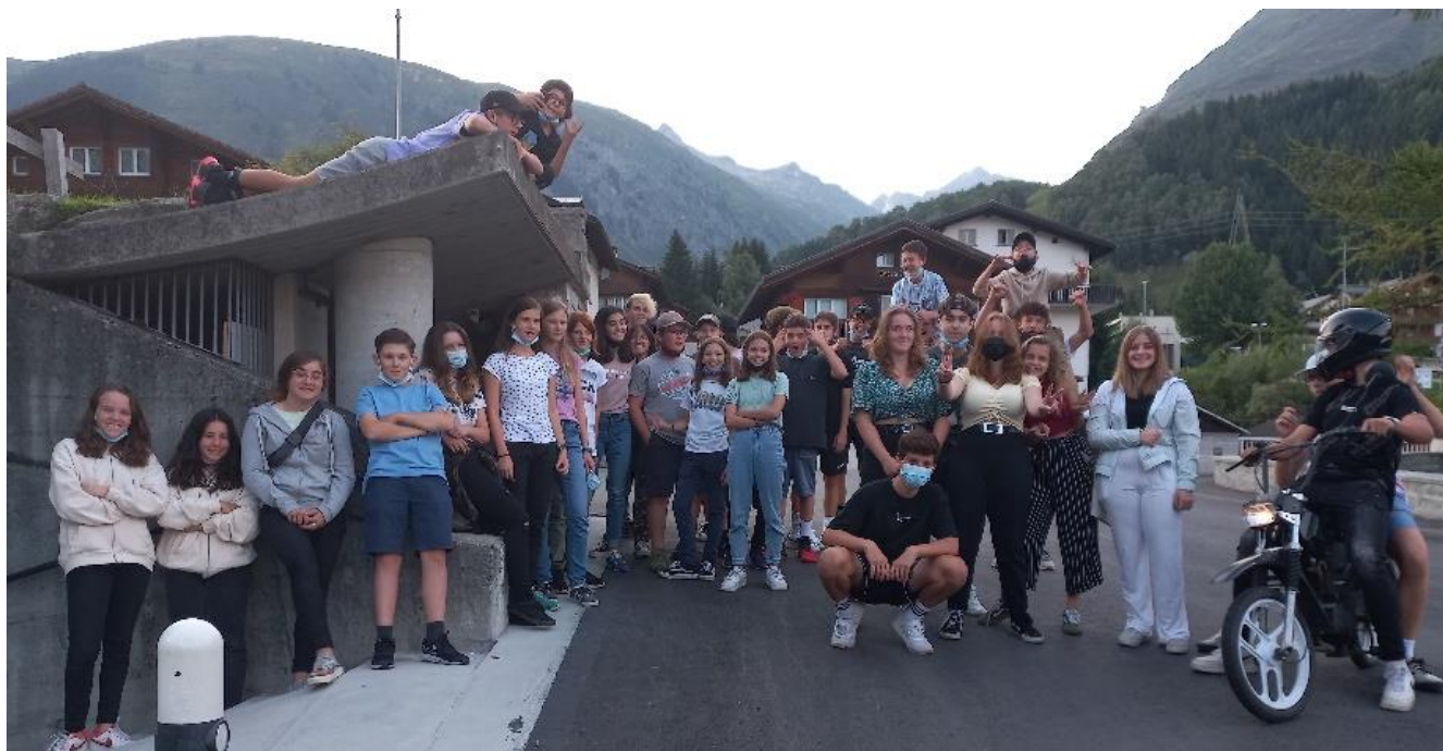
visitaders*as avon la Talina a Sedrun