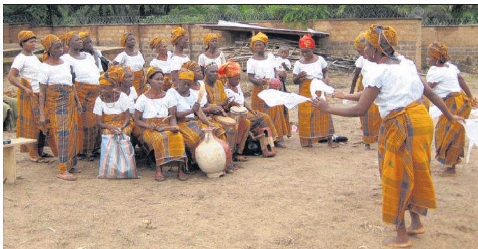
Die Frauengenossenschaft macht ihren Empfang.