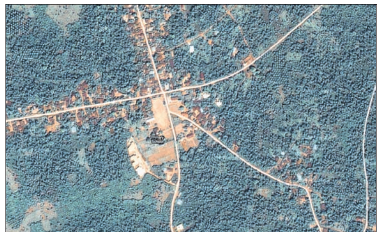
Eine Siedlung im Imo State, Umunumo selbst wird auf Google Maps nicht angegeben.

weitläufige Ansammlung von Häusern, Hütten, Wegen, Strassen und Plätzen. Diese grosse Siedlung im Wald liegt sozusagen im geographischen Niemandsland. Aus verständlichen Gründen haben es die Leute von Google Street View noch nicht bis Umunumo geschafft. Google Maps kennt kein Umunumo, und grosse Teile Nigerias sind auf der digitalen Landkarte nur als graues Feld angegeben. Der Unterschied zu westeuropäischen Verhältnissen könnte nicht krasser sein: Inwil LU zum Beispiel (wo Ozioma eine Zeit gelebt hat) zeigt sich auf dem Netz als strukturierte und bunte Gemeinde.