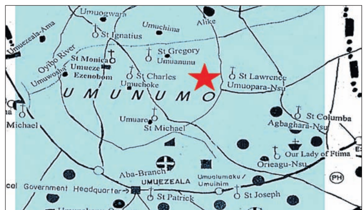
Ausschnitt aus dem von der MOF erstellten Lageplan des Ehime Mbando L.G.A.