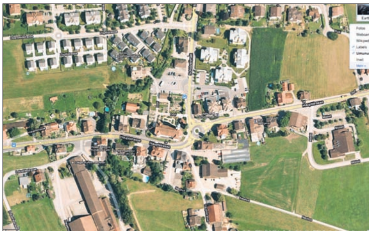
Inwil, wo Ozioma einige Zeit gelebt hat.