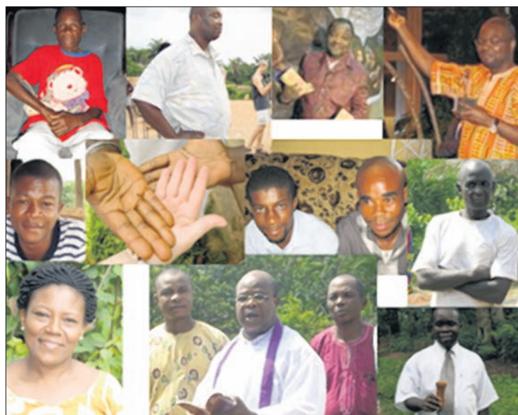
Einige Mitarbeiter, die sich in den Projekten der MOF engagieren.

Schon seit fast fünf Jahren betreiben wir eine Studie über die verwandtschaftlichen Bezüge der Menschen im Projektgebiet – wir erforschen also die Genealogie. Nur wenige ältere Menschen kennen noch die wichtigen Daten, während die meisten nur noch bruchstückhaft davon wissen. Die groben Daten wurden bereits im Auftrag der Stiftung gesammelt. Da die Studie nicht nur die verwandtschaftlichen Linien aufzeigt, sondern auch, welche Sippe oder Familie Vorrangstellung