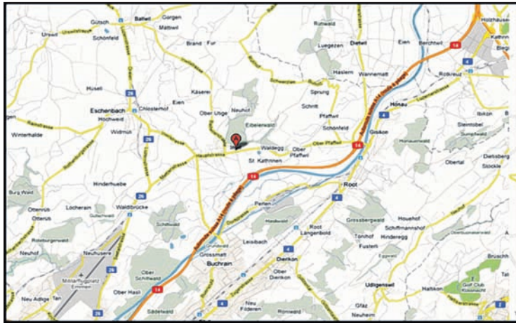
Die Region um Inwil in der Schweiz ist genauestens kartiert.