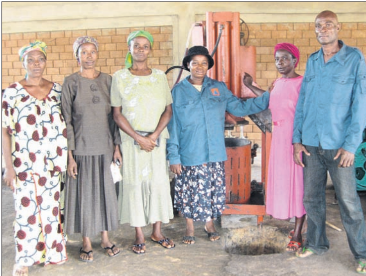
Die Leiterinnen und Angestellten der Mühle in der Saison 2010.

Was man alles aus ein paar Zahlen einer Excel-Tabelle ablesen kann, löste Staunen aus, aber auch helle Gesichter. Meine kleine Evaluation wurde von den Frauen interessiert aufgenommen und löste eine angeregte Diskussion aus. Ich bin überzeugt, dass die nächste Saison noch besser verlaufen wird als die erste.