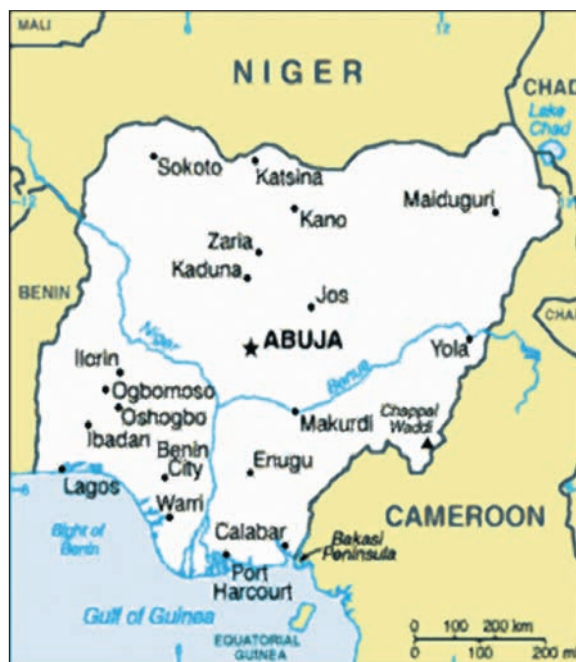
Umunumo liegt im Süden Nigerias oberhalb von Port Harcourt und Calabar.

Haben Sie ein Navigationsgerät in Ihrem Auto? Adresse eingeben, Start drücken – und im Prinzip (Ausnahmen bestätigen die Regel und haben häufig mit einer fast pseudoreligiösen Vertrauensseligkeit in die Technik zu tun) kommt man sicher ans Ziel. Nicht