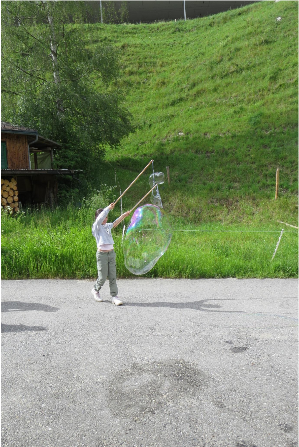
Frech und Wild und Wunderbar: «Kirche Kunterbunt» zum Thema «Wasser»