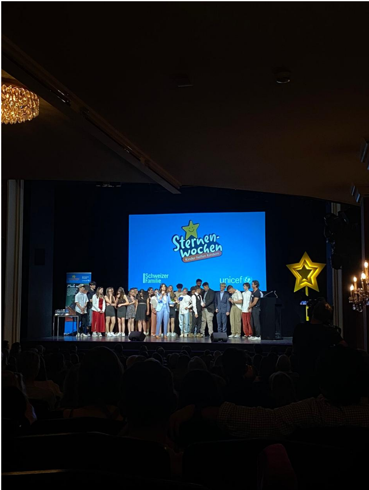
Die Disentiser Schülerinnen und Schüler, Religionsunterricht 1. und 2. Oberstufe gewinnen den Sternenwoche-Award 2023 – Preisübergabe im Schauspielhaus Zürich am 25. Mai 2024