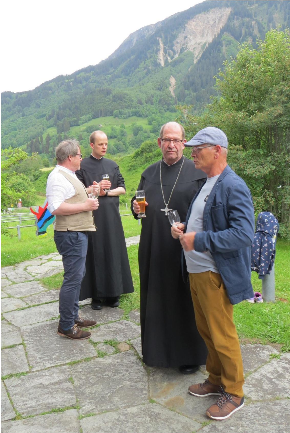
...Unsere Kirchgemeinde vernetzt in der lokalen Oekumene...