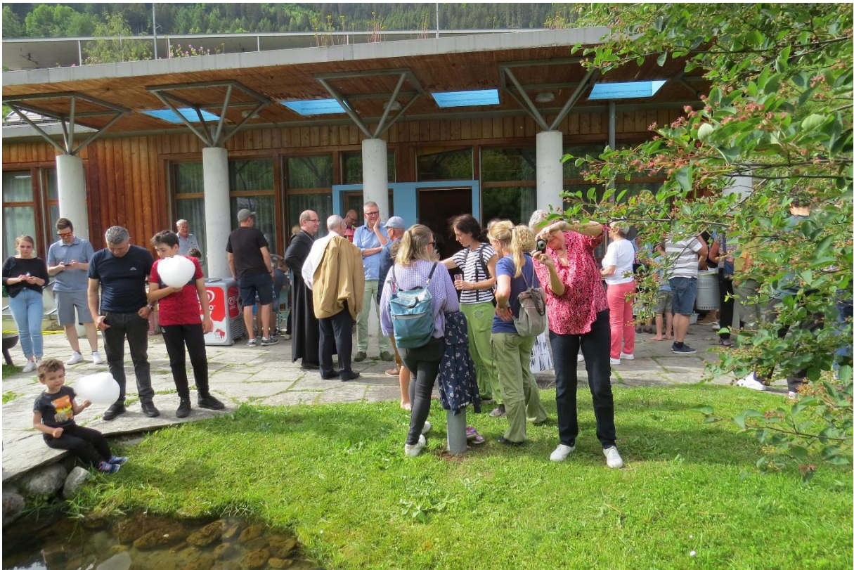
Einweihung des Biotops